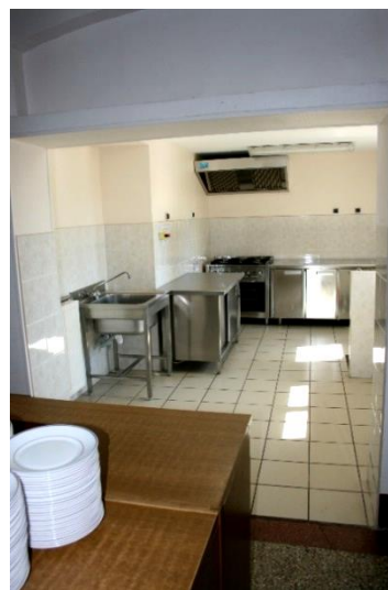
La salle polyvalente et la cuisine.

Salle pouvant accueillir environ 60 personnes. 12 tables de 1 m 83 X 0.60m à disposition et 70 chaises.